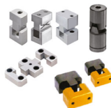
Blocos de Travamento